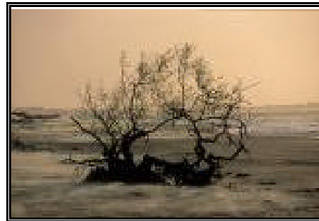
Pontal das Almas (Bitupitá)