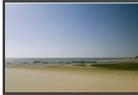
Vista da Praia Jericoacoara