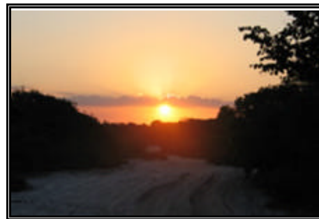
Trilha até Barreirinhas