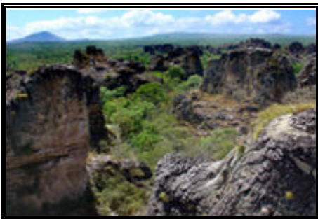
Parque Nacional de Sete Cidades

Saída pela manhã em passeio de lancha privativo conhecendo o Rio Preguiças, seus afluentes e a rica mata de manguezais além da exuberante fauna da região, visitaremos o Farol de Mandacaru (onde temos uma visão privilegiada da luxuriante natureza a nossa volta), e o pequeno povoado de Vassouras, depois continuamos nosso passeio até a praia de Caburé, uma pequena faixa de terra encravada entre o Oceano Atlântico e o Rio Preguiças, almoço no Restaurante da POUSADA PORTO BURITI depois voltamos aos veículos 4x4 trilhando o litoral em direção ao município de Paulino Neves. Faremos o percurso de volta passando pelos diversos vilarejos ao longo do caminho em direção ao Parque Nacional de Sete Cidades - Piauí, chegada prevista para o final da tarde, hospedagem no HOTEL 7 CIDADES localizado no interior do parque. Jantar no próprio hotel.