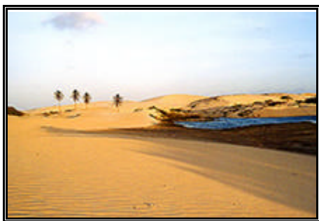
Vista da praia de Mundaú