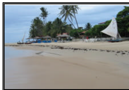
Praia de Flecheiras