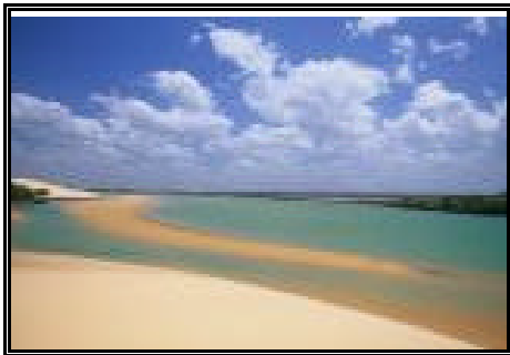
Barra dos Remédios