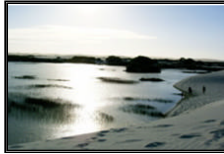
Vista dos Lençóis Maranhenses