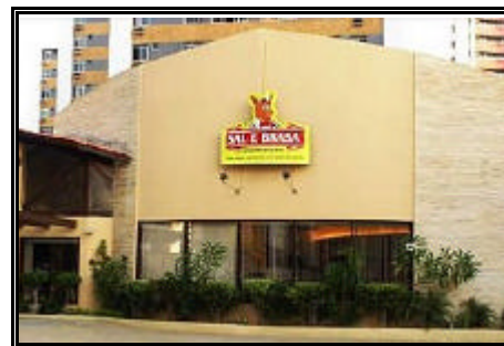
Churrascaria Sal e Brasa - Fortaleza