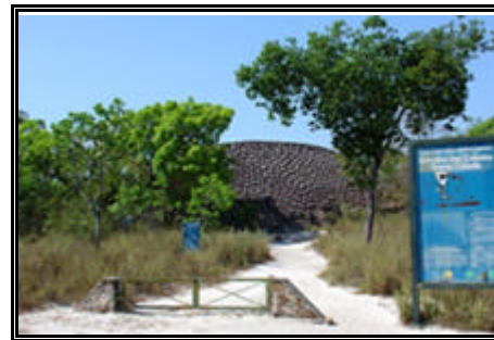
Parque Nacional de Sete Cidades