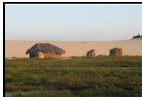
Vista dos Pequenos Lençóis Maranhenses