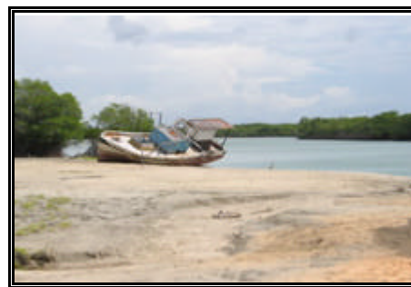
Torrões (Rio Aracati - Açú)