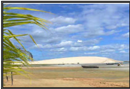
Vista das dunas de Jericoacoara