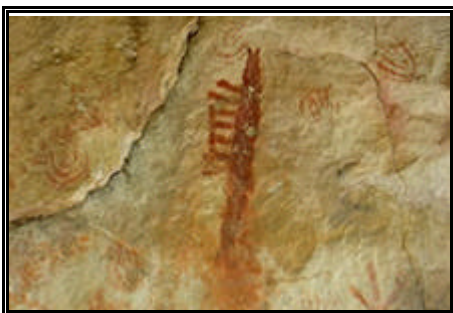
Pinturas rupestres de Sete Cidades

Pela manhã iremos fazer uma visita acompanhada de guias locais aos principais atrativos do Parque Nacional de Sete Cidades, após o almoço no restaurante NEBLINA seguimos por rodovias Federais em direção à Fortaleza. Chegada prevista para o início da noite, check in no HOTEL LUZEIROS . As 22:00 horas teremos um jantar de confraternização no Restaurante FAUSTINO , após o jantar regresso ao hotel, noite livre.