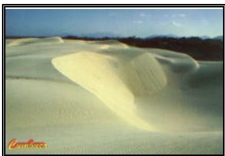
Vista das Dunas do Cumbuco

Saída conforme a maré iniciando nosso passeio pelas praias do Icaraí, Tabuba, Cumbuco, Barra do Cauípe, Pecém, Taíba e Paracuru, seguimos por estrada de terra até o município de Paraipaba e depois para a belíssima praia de Lagoinha, Guajiru (almoço no restaurante do REDE BEACH RESORT ). Após um breve descanso continuamos nosso passeio conhecendo as praias de Flexeias, Embuaca, Mundaú (travessia do Rio Mundaú), praia da Baleia, praia do Inferno, praia de Apiques e a exuberante praia de Amontada. De lá seguimos por estrada passando pelos municípios de Itarema, Acaraú e Cruz, novamente seguimos por estrada de terra em direção a praia do Prêa de onde continuamos nosso passeio pelo litoral até a famosa praia de Jericoacoara aonde ficaremos hospedados no HOTEL MOSQUITO BLUE . A noite jantar no Restaurante ESPAÇO ABERTO . Após o jantar noite livre em Jericoacoara.