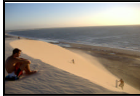
Vista do pôr-do-sol em Jericoacoara